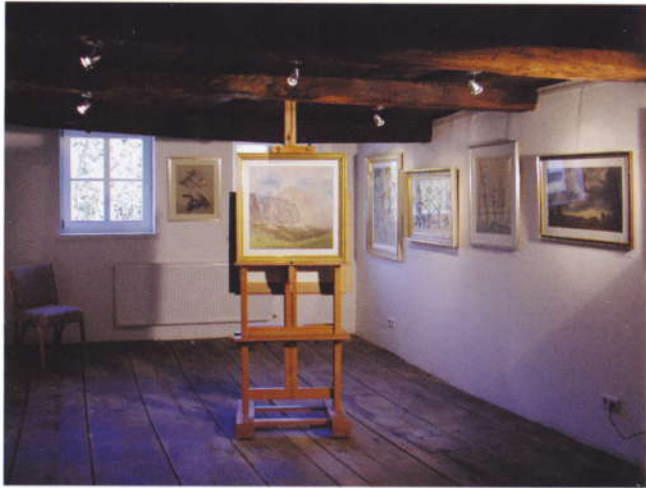
Altmeisterliches Können zeigen die Arbeiten des Künstlerehepaars Jutta und Bodo Meyner.