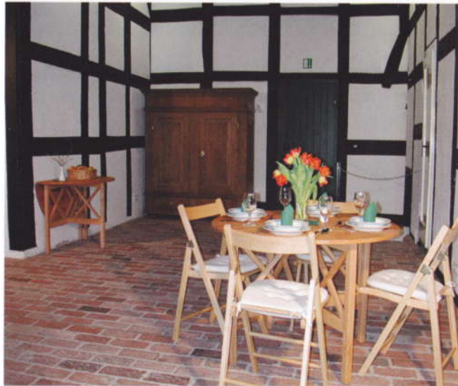
Die Deele – der zentrale Raum des Hauses – dient als Versammlungs- und Veranstaltungsraum. Er steht für künstlerische Veranstaltungen wie Vorträge, Kleinkunst, Konzerte oder für Sonderausstellungen zur Verfügung. Je nach Sitzordnung fasst der Raum bis zu 50 Personen.